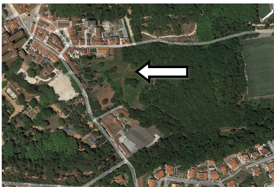
Localização da área alvo de alteração