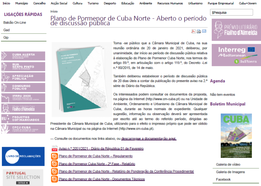
Figura 2. Publicitação e disponibilização do PPCN no portal do município