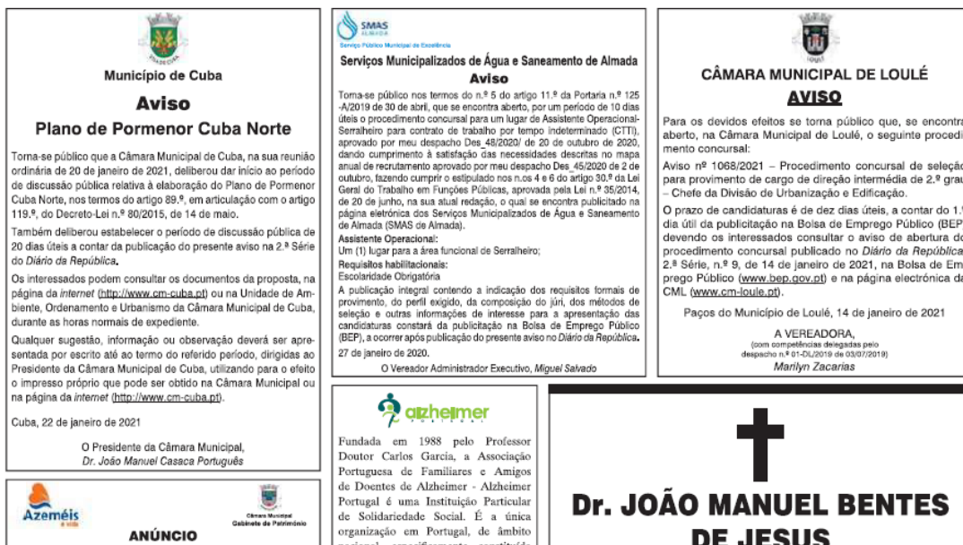
Figura 3. Publicitação na comunicação social do período de discussão pública do PPCN

Os direitos de propriedade intelectual de todos os conteúdos do Público – Comunicação Social S.A. são pertença do Público. Os conteúdos disponibilizados ao Utilizador assinante não poderão ser copiados, alterados ou distribuídos salvo com autorização expressa do Público – Comunicação Social, S.A. Público Classificados • Quarta-feira, 27 de Janeiro de 2021 • 27