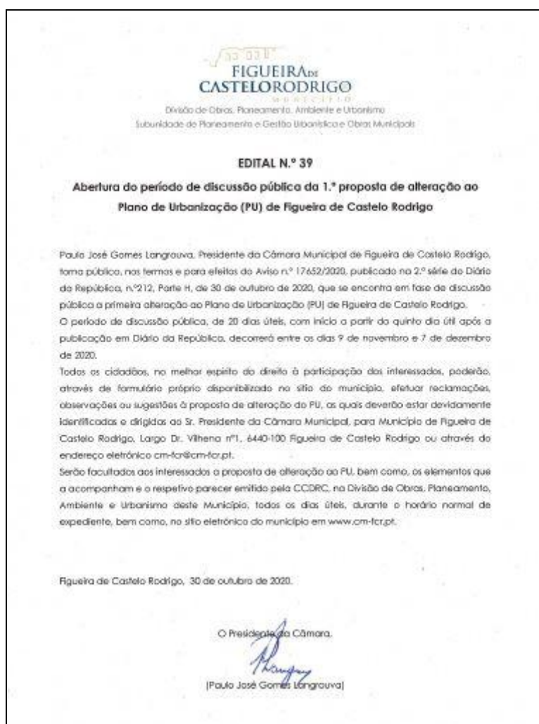
Figura 5: Edital afixado nos lugares de estilo do município

Finalmente, foi ainda promovido a afixação do Edital N.º 39, nos lugares de estilo do município para que todos os interessados pudessem ter conhecimento da abertura do período de discussão pública da 1.ª proposta de alteração ao PU FCR, bem como, os termos nos quais a mesma se concretizava.