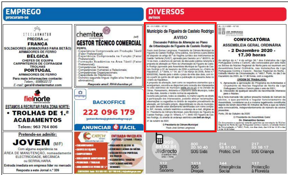
Figura 2: Extrato do Aviso publicado no Jornal de Notícias

A divulgação da fase de discussão pública da 1ª alteração ao PU FCR foi também publicada no sítio eletrónico do município, de acordo com o n.º1 do artigo 89.º do RJIGT, na página inicial, onde foi disponibilizado um texto explicativo do procedimento de alteração do plano, bem como, todos os documentos que constituem a proposta de alteração do PU FCR, dando a possibilidade a todos os interessados de aí ser efetivada a respetiva consulta ao procedimento de alteração.