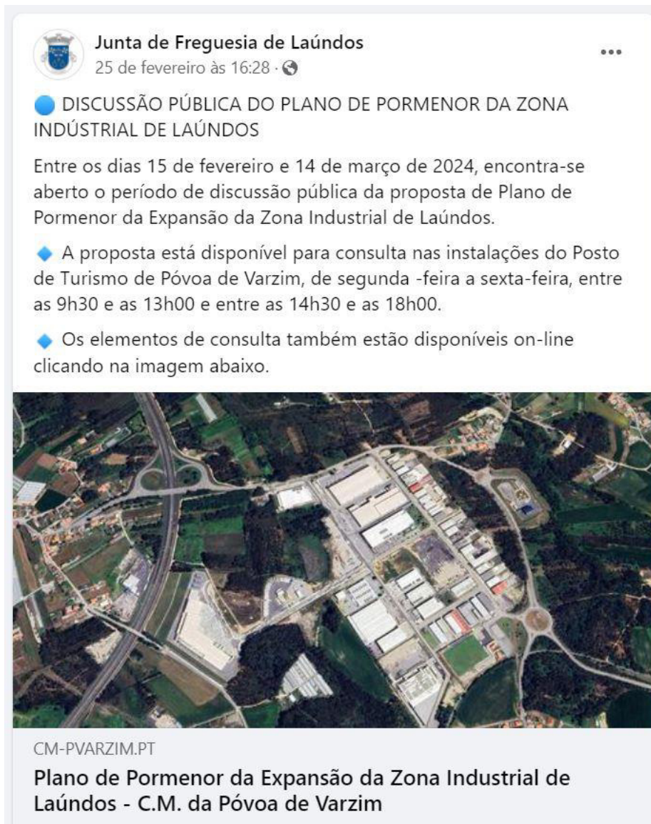
Figura 8: Divulgação da discussão pública do PPEZIL em redes sociais pela Junta de Freguesia de Laúndos