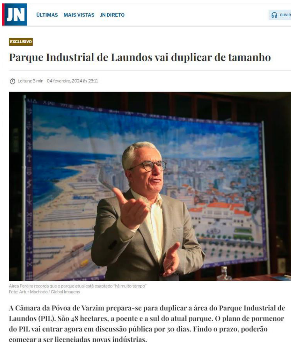
Figura 7: Divulgação da discussão pública do PPEZIL em jornal online “Jornal de Notícias”