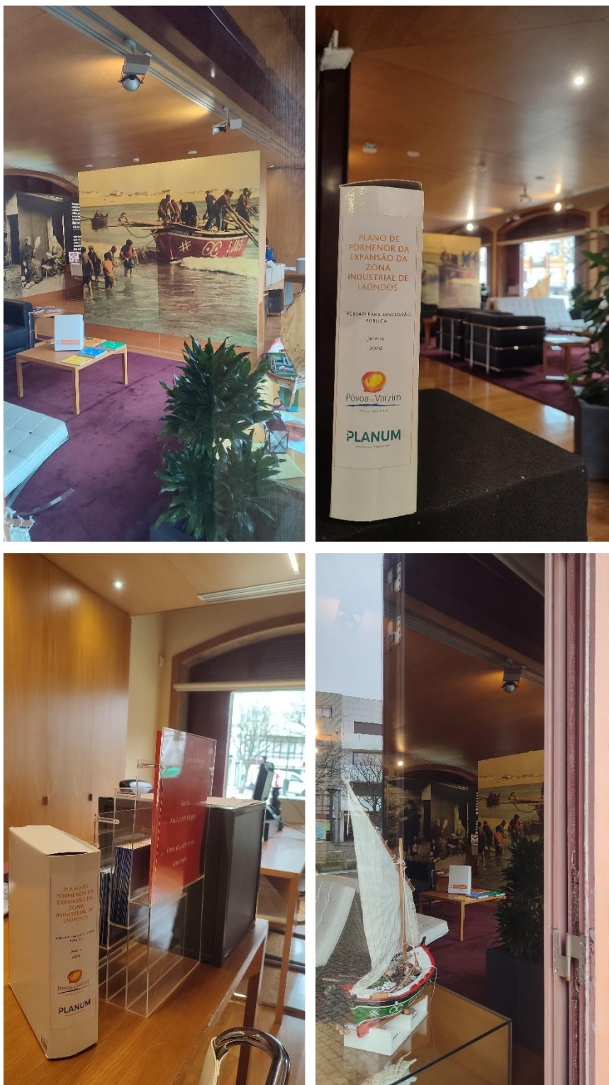
Figura 6: Divulgação da discussão pública do PPEZIL – disponibilização dos elementos no Posto de Turismo do concelho