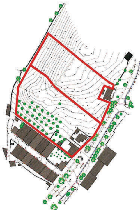
Parcelas municipais a reclassificar