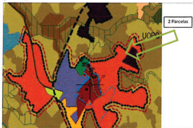
Extrato da Planta de Ordenamento do PDM