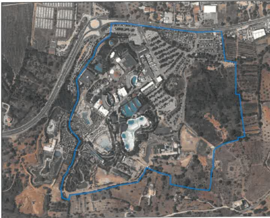
— Limite de Intervenção do Plano de Pormenor do Zoomarine