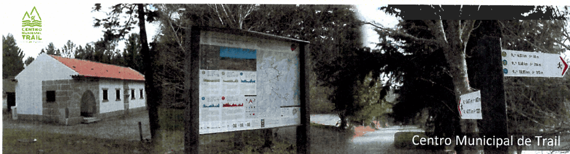
Centro Municipal de Trail